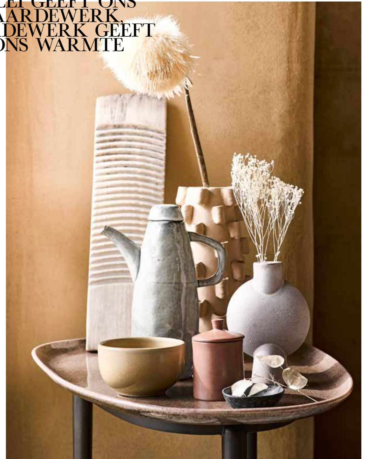
Tafeltje l'Objet € 905,- ( edha-interieur.nl ). Geel kommetje rechts € 4,-, theepot € 54,50, lichtroze vaas met bolling € 34,- ( loods5.nl ). Wasbord € 29,95 ( thingsilikethingsilove.com ). Gedroogde bloemen prijs op aanvraag ( tuinvanjudith.wordpress.com ). Vaas met kleine rondjes erop € 45,99, kleine ovale blauwe kom uit een set met 2 kopjes en langwerpige schaal € 22,99 ( zarahome.com ). Terrakleurige pot met deksel € 17,95 ( maisonnL.com ).